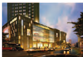
Centros de Negocios