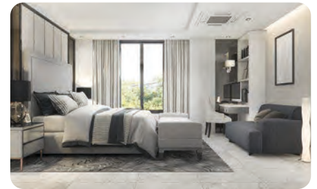
Servicios de Renta Temporal