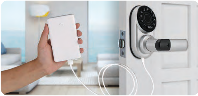
Puerto Micro-USB para Aperturas de Emergencia