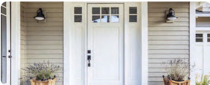
Entradas Principales (sólo para ML200)*