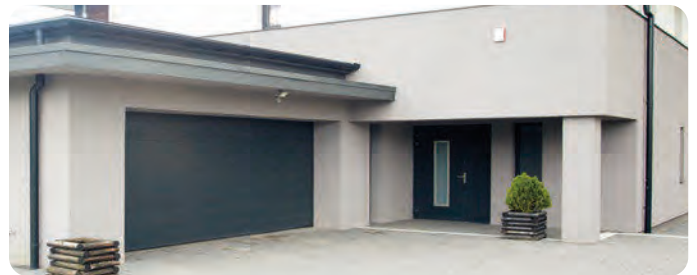
Entradas de Garage (sólo para ML200)*

*No se recomienda la instalación de productos con sensor de huella digital (ML300) en espacios donde el sol o el agua puedan tener un contacto excesivo.