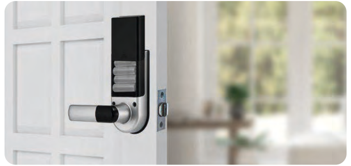
Bajo Consumo de Energía